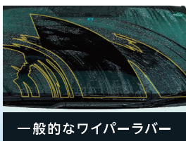
一般的なワイパーラバー