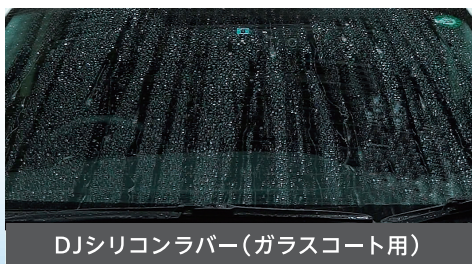
DJシリコンラバー(ガラスコート用)